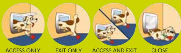
ACCESS ONLY EXIT ONLY ACCESS AND EXIT CLOSE